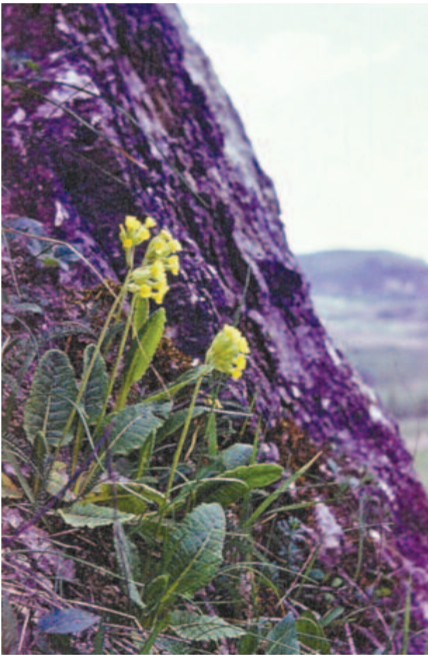
Kankalin a korondi Aragonit-dombon 1978-ban

(...) A somvirágos oldal lejtőjén túl, alul, kő- és keresztfa-sorral kis temető lapul.