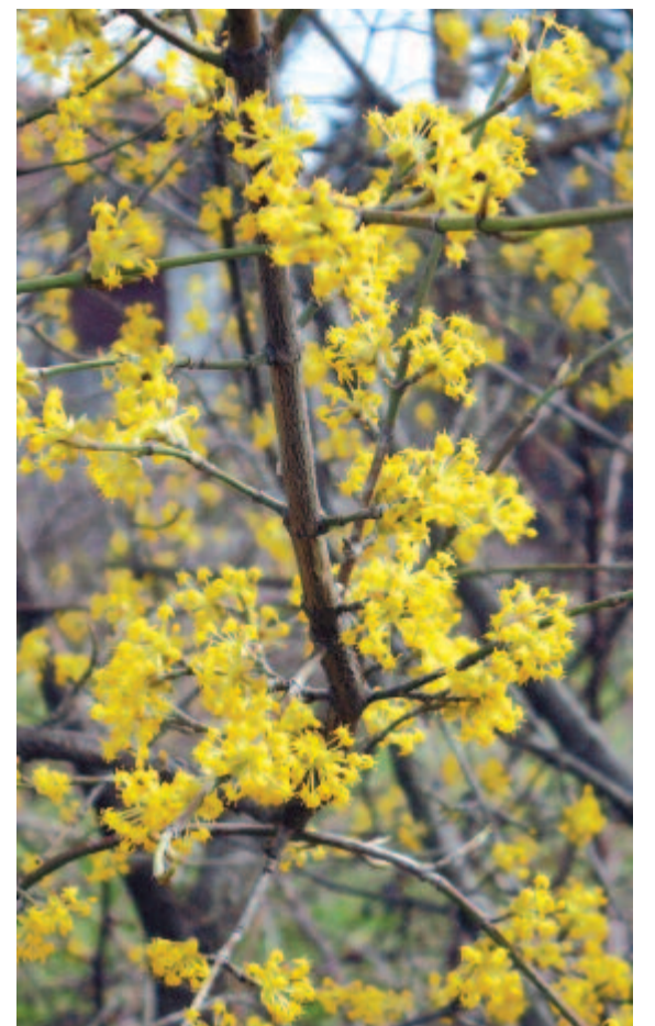
Langyosságoddal rájuk lehelj, s kipattan a sárga kis kehely